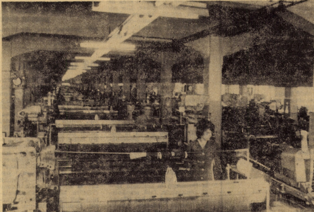
Aspect cotidian de muncă din secția țesătorie a întreprinderii „Textila” Cisnădie, unitate economică de prestigiu a industriei ușoare sibiene și românești

La invitația tovarășului Nicolae Ceaușescu, secretar general al Partidului Comunist Român, președintele Republicii Socialiste România, și a tovarășei Elena Ceaușescu, tovarășul Kenneth David Kaunda, președintele Partidului Unit al Independenței Naționale, președintele Republicii Zambia, va efectua, împreună cu tovarășa Betty Kaunda, o vizită oficială de prietenie în Republica Socialistă România, în prima parte a lunii septembrie 1980.