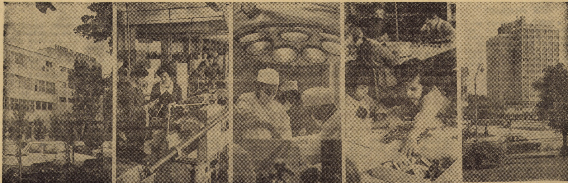
Cincisprezece ani de istorie nouă, de viață prosperă și fericită, de muncă avîntată și succese deosebite, în cîteva ipostaze proprii județului Sibiu