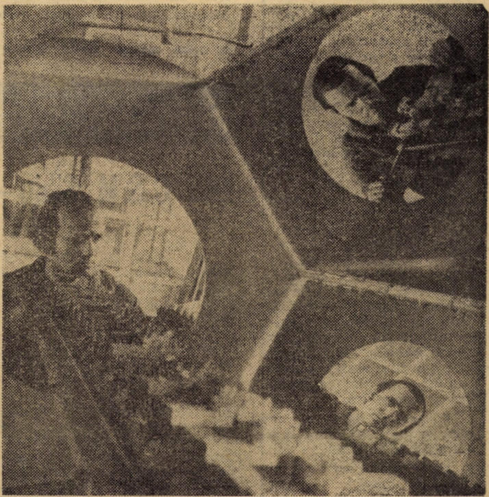
Munca – suprema noastră vocație, făuritoare de exemplare destine muncitorești și generatoare de mari performanțe

Următorul număr al ziarului nostru va apărea luni, 25 august, a.c.