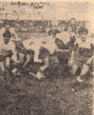
Aspect din partida de rugby C.S.M. Sibiu - Rapid București încheiată cu rezultatul de 3-3

Rezultatele primei etape din divizia B, seria a II-a: Rulmentul - Metalul Plopeni 2-0; Sirena - C. S. Tirgoviște 2-2; Metalul București - Tractorul 3-0; ROVA Roșiori - Pandurii 2-0; Poiana - Nitramonia 3-0; Chimica - Petrolul 0-0.