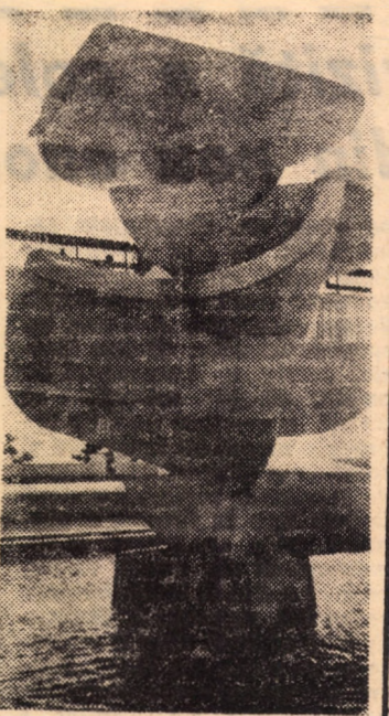
Pe litoral

Casa de cultură a tineretului din Sibiu face înscrieri pînă în 15 septembrie a.c. la următoarele cercuri și cursuri: croitorie (femei și bărbați), radio TV, stenodactilografie, desen tehnic, fotocineclub, limbi străine (engleză, franceză, germană). Înscrierile se fac zilnic între orele 8-12 și 17-20.