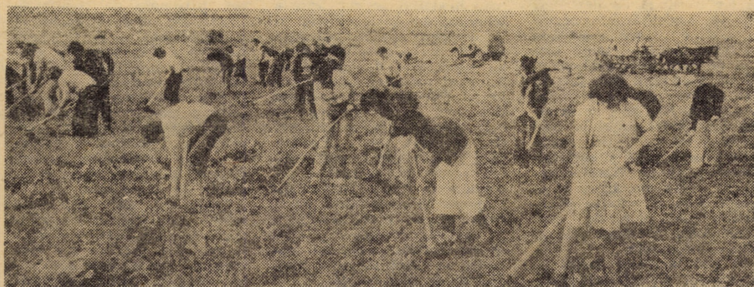
Zilnic, zeci de tineri din compartimentele T.E.S.A. de la F.I.P.A., I.M.C.A. și F.U.A. Agnita dau o mîină de ajutor la întreținerea culturilor pe terenurile fermei legumicole a C.A.P. Agnita