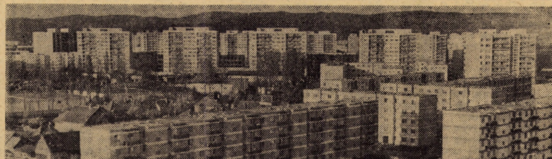
Din peisajul arhitectural al Sibiului