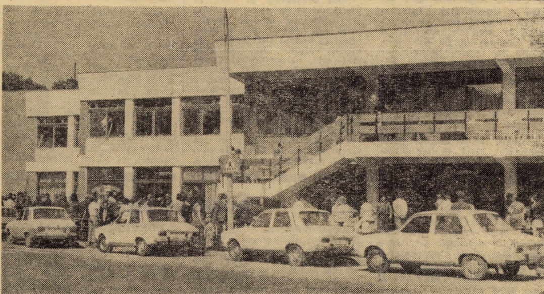
Printre unitățile comerciale construite în anii din urmă în municipiul Sibiu figurează și Complexul comercial din șos. Alba Iulia