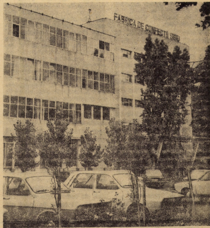
Fabrica de confecții „Steaua roșie” din Sibiu se bucură astăzi de aprecieri unanime din partea beneficiarilor interni și externi pentru calitatea ireproșabilă a articolelor de îmbrăcăminte pe care le produce

Istoria ca știință și argument politic militant trebuie să confirme și să demonstreze cu putere de netăgăduit că aici ne-am născut ca popor și ca stat, aici am trăit permanent și am luptat cu prețul unor grele sacrificii pentru afirmarea plenară ca popor și națiune, că nu pretindem nimic ce nu este al nostru de la nimeni, dar nici nu vom ceda nimănui nimic din ceea ce ne aparține.