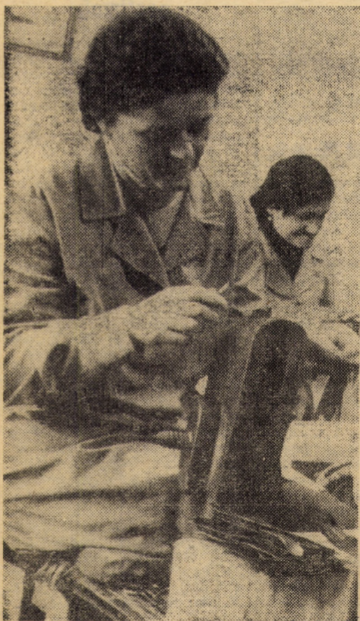
Broderie în piele la unitatea de marochinărie din Săliște, aparținînd de cooperativa „Arta Sibiului”