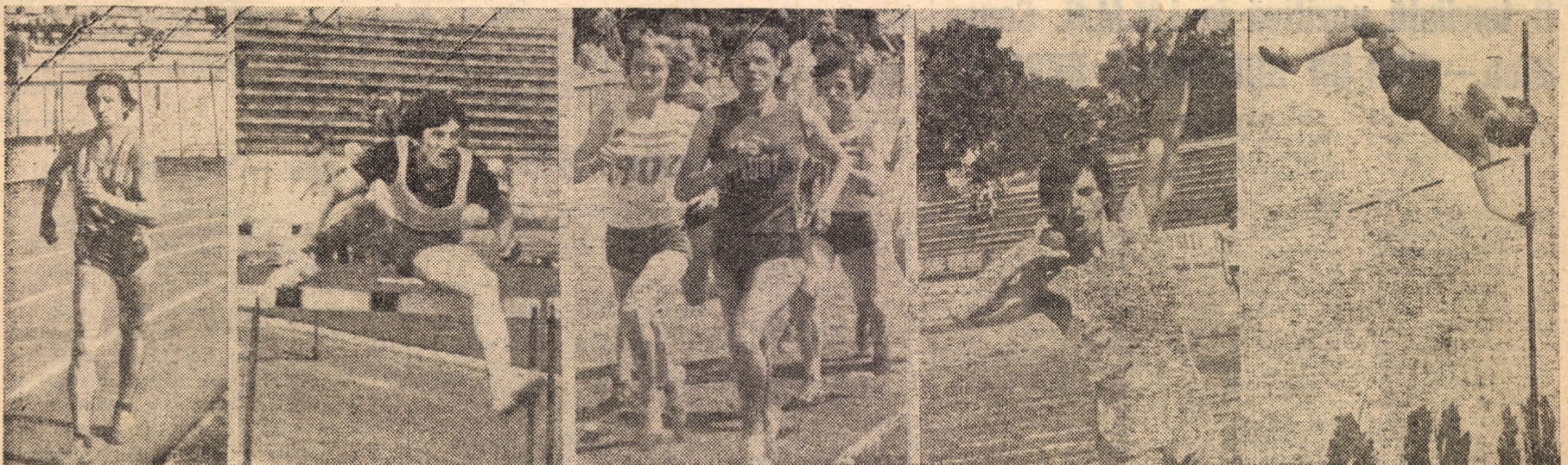
Aspecte de la „Cupa României”, etapa a II-a la atletism