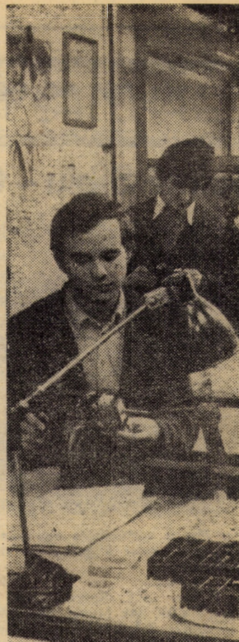
Atelierul electric II al ICEMENERG, filiala Sibiu. Printre aparatele construite aici se numără diferite relee, truse de verificare, electroventile etc. necesare hidro- și termocentralelor