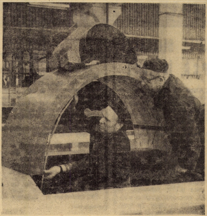
În cadrul atelierului modelărie al secției turnătorie de la întreprinderea „Independența” din Sibiu, maistrii tîmplari cu o bogată experiență profesională, asigură modelele necesare turnării unor piese de mare complexitate.

• Un grup de pionieri de la Școala generală Șarș pornește într-o excursie pe Valea Gurghiului (26.VI.). • Casa pionierilor și șoimilor patriei Tălmăciu organizează un concurs de triciclete, trotinete și biciclete (28.VI.). • Membrii cercurilor de desen, tapițerie, confecții de la Casa pionierilor și șoimilor patriei Mediaș efectuează o excursie la Cheile Rîmețului (30.VI.). • Pionierii unităților școlilor generale din Dumbrăveni participă la dezbaterile „Dezarmarea — imperativ esențial al păcii și securității în lume”, organizată la sediul Casei pionierilor și șoimilor patriei din localitate (1.VII.). • Membrii cercurilor Casei pionierilor și șoimilor patriei din Copșa Mică participă la tabăra de corturi organizată în perioada 25.VI.—2.VII. la Geoagiu-Băi.