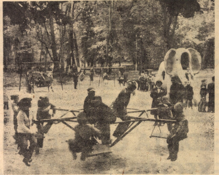
O atracție pentru cei mici: locul de joacă din parcul „Sub arini” din Sibiu.