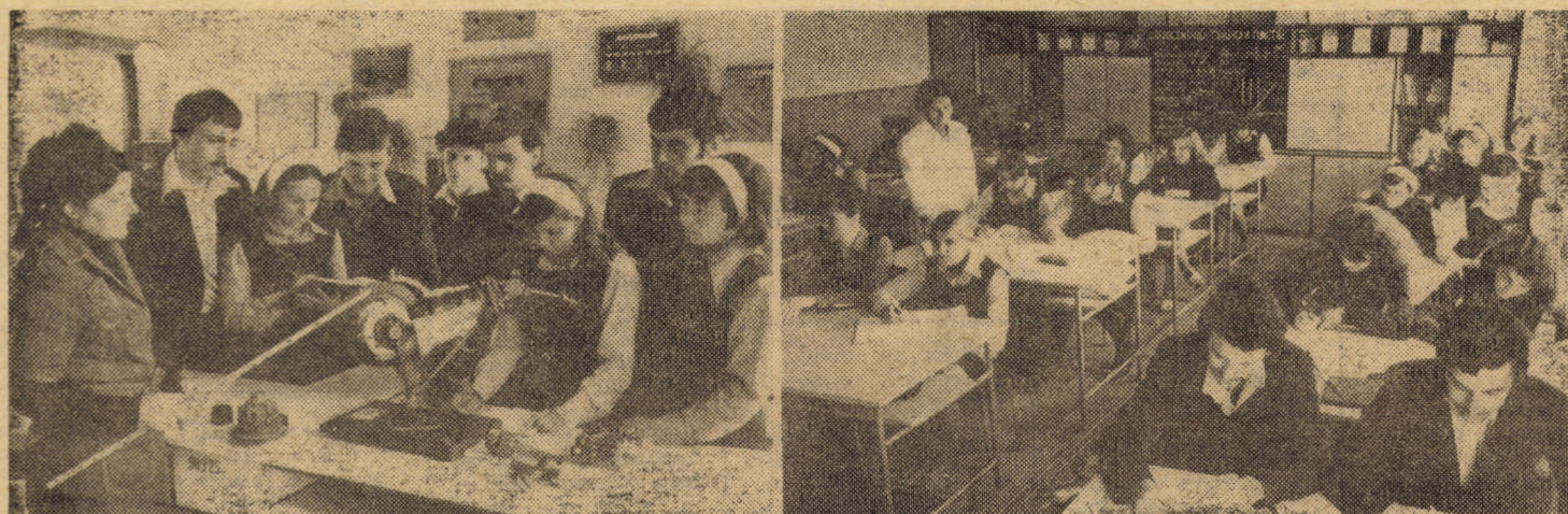
Condiții excelente pentru pregătirea viitorilor constructori la Liceul industrial nr. 6 din Sibiu

La întreprinderea de piese auto Sibiu, în cadrul acțiunilor de modernizare a liniilor de fabricație, se află în probe tehnologice trei agregate cu masă rotativă pentru fabricația mecanismelor de direcție servoașitate. Proiectate și executate de către specialiștii întreprinderii sibiene în colaborare cu I.C.P.T.C.M. București, noile utilaje înlocuiesc pe linia respectivă de fabricație 12 mașini de găurit și asigură o productivitate de 4 ori mai mare.