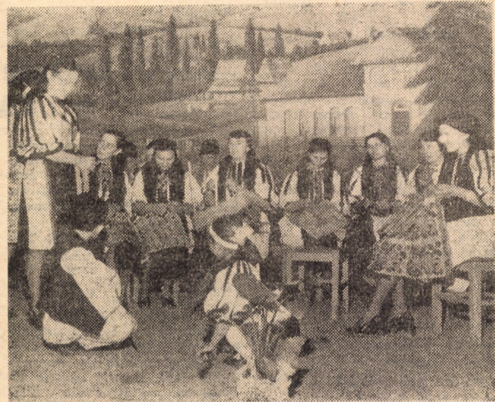
Secvență dintr-un reușit spectacol folcloric susținut de formația artistică a Căminului cultural din Poiana Sibiului.