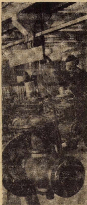
La întreprinderea mecanică gaz metan Mediaș reînnoirea producției se face într-un ritm susținut

(Continuare în pag. a III-a) ION SORESCU