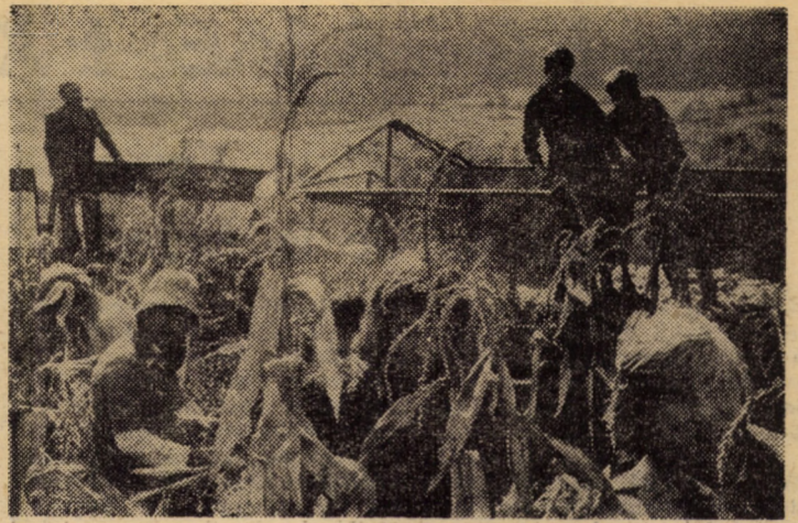
A început recoltarea porumbului. După cum se vede din instantaneul nostru fotografic, elevii se dovedesc de mare ajutor în sprijinirea acțiunilor de strîngere și depozitare a recoltelor