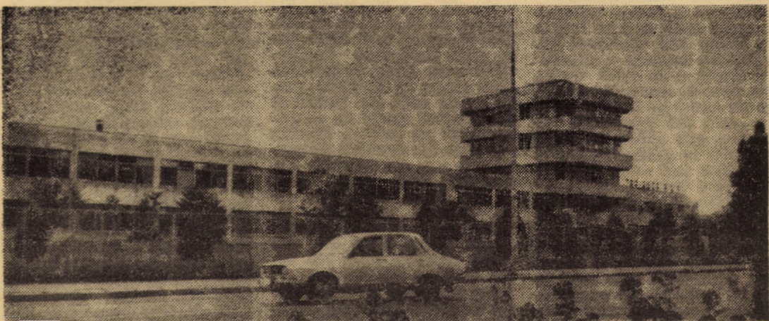
Întreprinderea poligrafică Sibiu — una din unitățile industriale sibiene a cărei faimă a trecut de muk hotarele țării