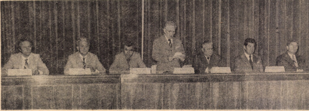
(Continuare din pag. 1)

P.C.R., a Consiliului popular județean, apreciind importanța temelor ce vor fi abordate pe parcursul celor două zile ale sesiunii. A fost subliniată însemnătatea acestei manifestări științifice medicale care se desfășoară în condițiile înfăptuirii cu succes în toate domeniile de activitate a hotărârilor Congresului al XI-lea al partidului, a Programului partidului, de avânt patriotic cu care întregul nostru popor acționează strâns unit în jurul