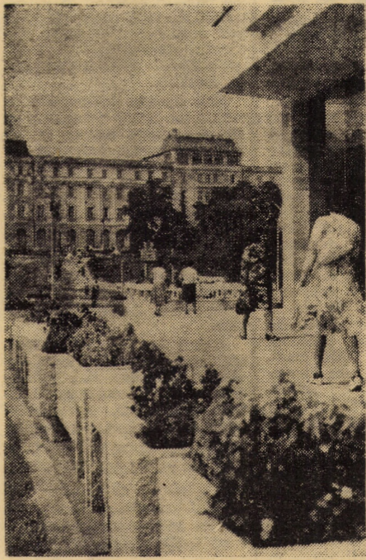
Frumosul cotidian: Piața Unirii Sibiu