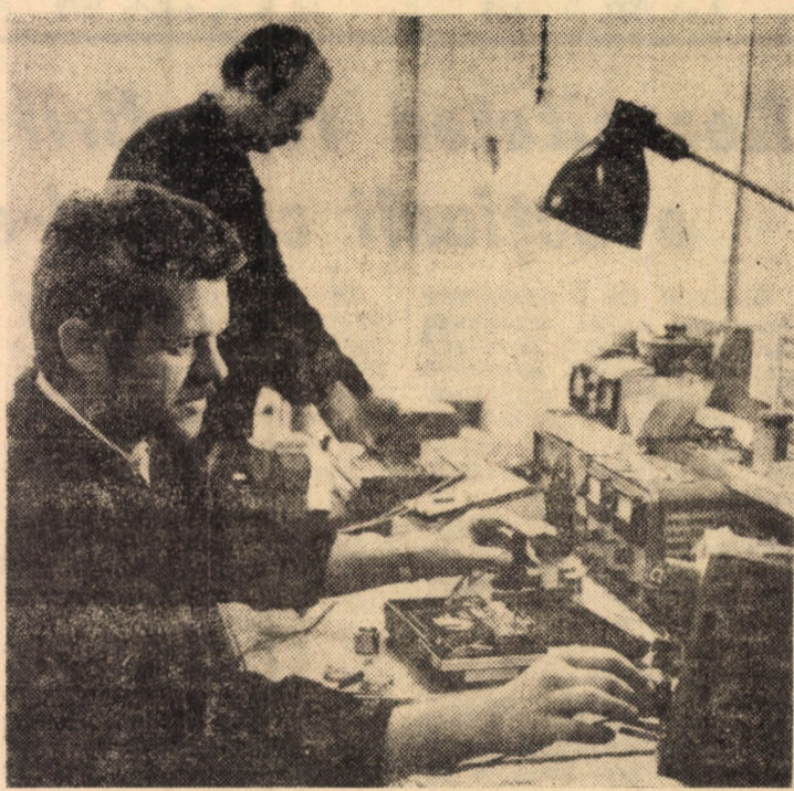
Printre unitățile prestatoare de servicii ale cooperativei „Tehnica nouă” Sibiu, care și-au cîștigat un bun renume, se numără și atelierul de reparat magnetofone, radio, casetofone din cadrul complexului comercial din șos. Alba Iulia, Sibiu

amplul proces de materializare a unor obiective ce asigură propulsarea țării pe noi trepte de progres și civilizație. Regîndirea creatoare, permanentă a acțiunii culturale în condițiile impetuozelor dezvoltări a României socialiste trebuie să devină o practică cotidiană, suportul stabil al trecerii la o nouă calitate în cultură.