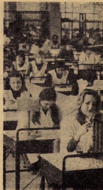
Aspect din secția montaj a întreprinderii de relej Mediaș

În cazul plăcuțelor cu numere de înmatriculare de material plastic sau a celor necorespunzătoare, unitățile deținătoare vor asigura confecționarea acestora din tablă, conform noului model.