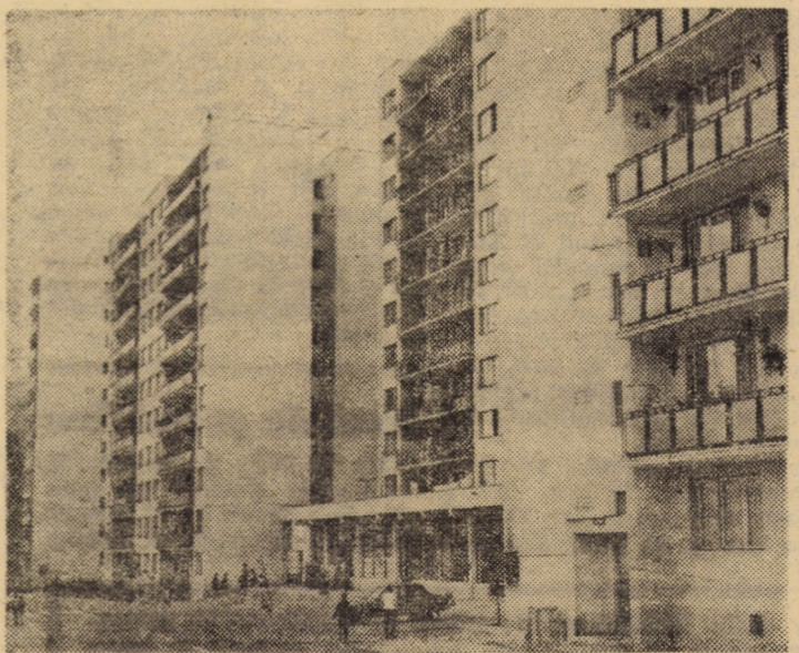
Blocul nr. 48 cu zece etaje din cartierul Gura Cîmpului, Medias la parterul căruia există un complex comercial.

Avem, toți cei ce slujim cu pricepere și pasiune știința și tehnica românească, un program de acțiune conturat cu limpezime, ce ne îndeamnă să vibrăm, convingător să ne concentrăm întreaga forță creatoare pe unul din domeniile-cheie ale creșterii economice. Am convingerea că ne vom da toată osteneala, cei ce muncim pe frontul amplu al inovării și creației tehnice, să întărim spiritul revoluționar în întreaga noastră activitate, să împlinim întocmai obiectivele de lungă perspectivă ale unui program de o exemplară clarviziune științifică.