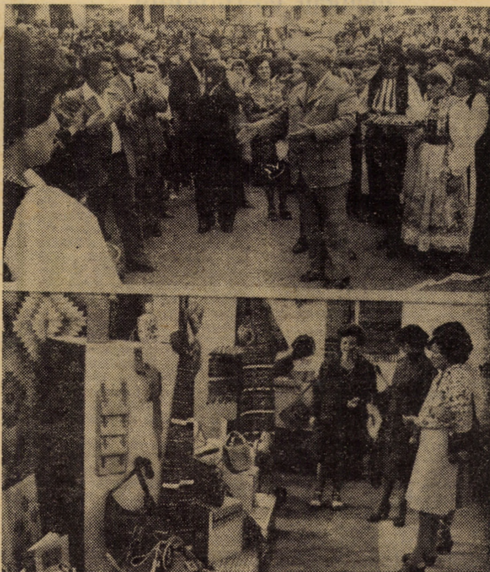
Imag. 1 de la deschiderea oficială a Tîrgului breslelor, în Sibiu.

Ieri după-amiază, în Piața 6 Martie din Sibiu s-a inaugurat Tîrgul breslelor, manifestare ce-și propune, chiar de la prima ediție, popularizarea în rîndul masei de cumpărători a serviciilor precum și a celor mai izbutite produse realizate de meșteșugarii cooperatori. Demn de relevat este faptul că la acest tîrg, organizat în premieră pe țară, participă toate cooperativele meșteșugărești din județul Sibiu: „Tehnica Nouă”, „Timpuri Noi”,