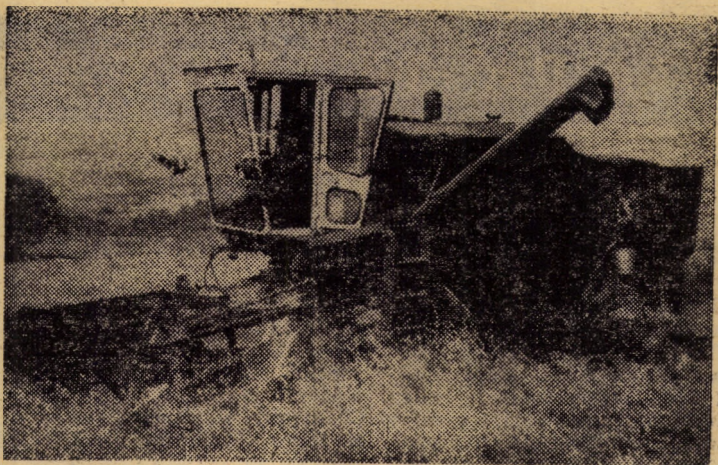
Duminică, în piscul Ilimbavului