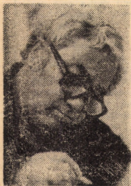
„Cum spuneai? Critică obiectivă și partizană. Da, te-am notat...” (Romul Munteanu)