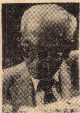
Sigur, o revistă de critică literară! Dacă nu-i, sînt „Colocviile”... (Mircea Zăciu)