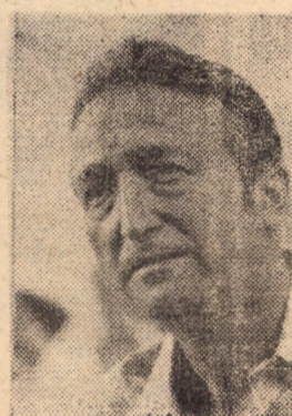
Nu-i chiar atât de simplu. Mă detașez... (Al. Simion)