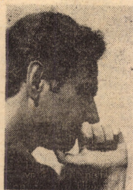
Și totuși trebuia să fim aici... (Livius Ciocărlie)