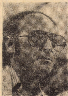
Încă de la Tudor Vianu ar trebui să știm... (Constantin Crișan)