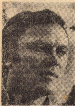
O precizare: nu sînt criticul obsedantului deceniu... (Marian Popa)