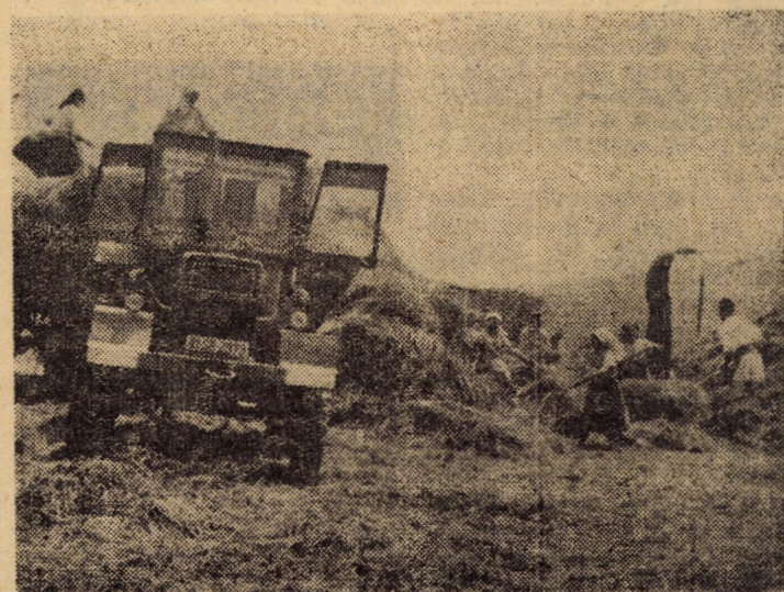
C.A.P. Alămor: o echipă completă pregătește baza furajeră însluzind importante cantități de masă verde

În zilele următoare, la parterul noului cămin se vor da în folosință un cabinet medical de consultații și unul stomatologic.