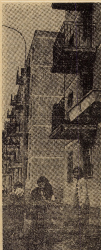
În noul cartier de locuințe „Vitrometan” din Mediaș