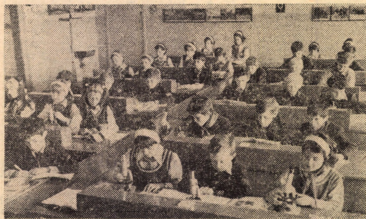
Imagine din laboratorul de biologie al liceului „Ștefan Ludwig Roth” din municipiul Medias

anul acesta, odată cu primul clopoțel, copiii lor să învețe în noua școală. Pentru aceasta, zilnic, părinți și elevi, în orele lor libere contribuie din plin la finalizarea lucrărilor. Investiția se realizează și prin contribuția bănească a cetățenilor din comună.