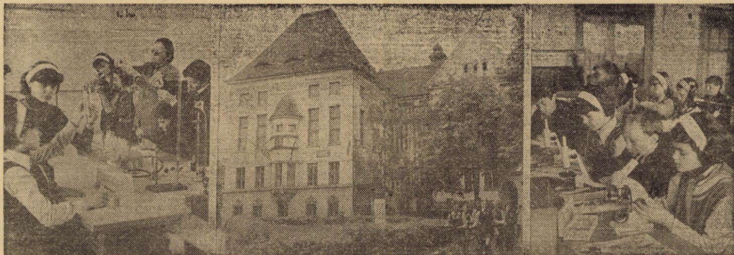
Liceul „Stefan Ludwig Roth” din Medias