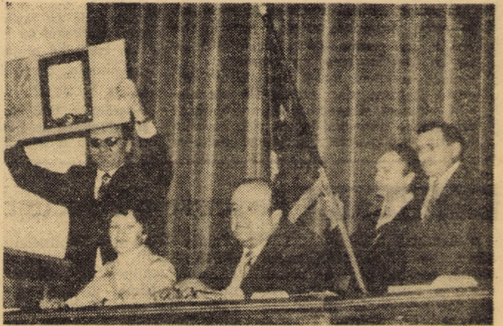
Aspect din timpul decernării Drapelului de întreprindere fruntașă pe ramură și Diplomei de onoare