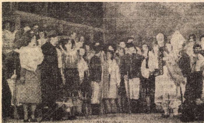
Scenă din spectacolul cu opereta „Crai nou” de C. Porumbescu, prezentat de elevii Școlii populare de artă Sibiu, la Casa de cultură a sindicatelor, în faza județeană a Festivalului național „Cintarea României” - ediția a II-a