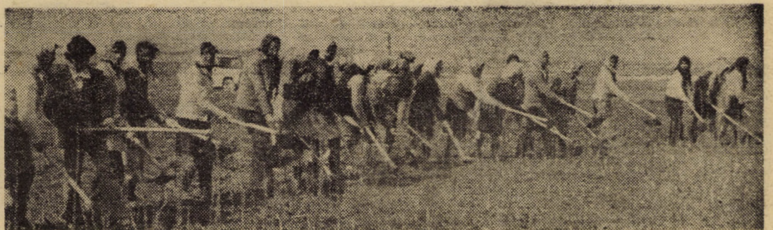
Stațiunea de cercetări și producție pomicolă, ferma Il Șura Mică. Aici se desfășoară o intensă activitate pentru realizarea de material săditor. Obiectivul fotografic a surprins o secvență din munca echipelor care execută întreținerea celor peste 1,3 milioane pomi fructiferi și 150 000 tranșadafiri plantați aici

Expunerea este completată cu filmul documentar în culori „Porțile tăcerii — muzica polifonică în universul gotic”.