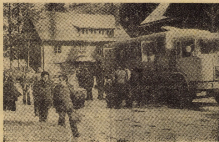
Duminică la Păltiniș

Înlocuitori eficienți ai metalului, materialele plastice își extind sfera de utilizare, în special în industria construcțiilor de autovehicule, domeniu în care ponderea reperelor și pieselor de schimb, confecționate din poliesteri armați, depășește 5 la sută din totalul consumului de oțel laminat. În acest context, recent, la întreprinderea „Automecanica” din Mediaș a început fabricația unor piese și subsansamble ale autoutilitarelor din plăci de poliester armat cu fibre de sticlă — produs realizat în industria noastră chimică după un procedeu românesc și care pe lângă o rezistență deosebită la uzură și forță de rupere, are și un preț de cost redus. Numai prin înlocuirea metalului utilizat la confecționarea ușilor unor furgioane de transport se obține o reducere a consumului cu circa 900 tone tablă metalică și o scădere substanțială a costurilor. Aceste rezultate au impulsivat lărgirea în continuare a sferei de folosință a înlocuitorilor plastici ai metalului, specialiștii studiind în prezent, trecerea la fabricarea pe scară industrială a unor noi componente ale autotururilor și autotrenurilor. (Agerores)