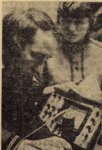
În laboratorul de încercări fizice al întreprinderii mecanice Mirșa

A fost modificat orarul serviciului cu publicul al Cărfii funciare care funcționează în clădirea Consiliului