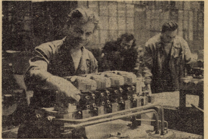
Aspect din secția elemente HP (Balanta II)