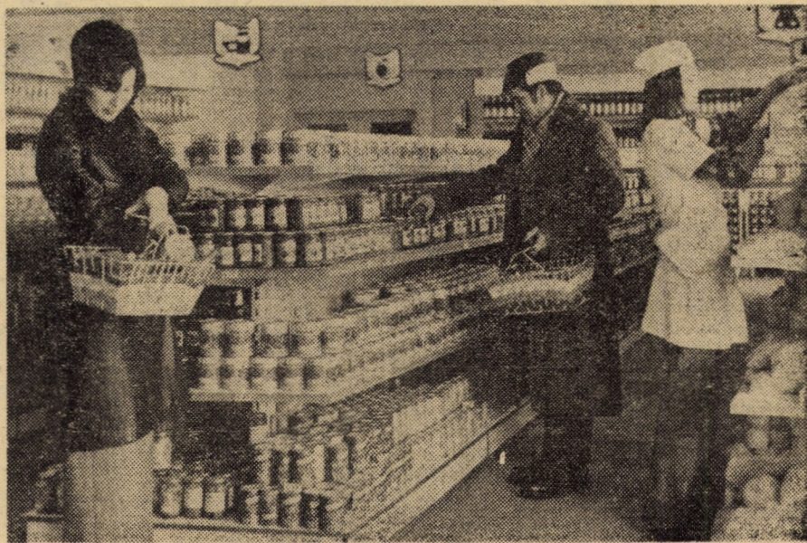
De la deschidere și pînă în prezent, la magazinul alimentar cu autoservire din cadrul noului complex „Dacia” din Agnita s-au vîndut mărfuri în valoare de peste 500 000 lei

În întreprinderea de geamuri Mediaș se află în curs de modernizare cuotorul nr. 3, a cărui capacitate urmează să crească în final cu 60 la sută. Constructorul — Șantierul Blejoi — a încheiat lucrările de fundații, trecînd acum, cu un avans apreciabil față de grafice, la executarea stîlpilor de susținere. Ca un amănunt semnificativ, în ultimii 6 ani toate cuptoarele întreprinderii de geamuri Mediaș au suferit procese de modernizare.