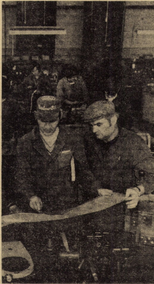
Atelierul de instalații hidraulice al întreprinderii „Balanța” Sibiu. Aici recent, s-au realizat o serie de automatizări la unele utilaje cu programare, utilaje folosite în industria alimentară și ceramică, la prelucrarea materialelor prime sub formă fluidă, granule și pulverulente

Recent, în cadrul sectorului zootehnic al I.A.S. Nocrich, a fost dat în folosință un nou utilaj menit să contribuie la valorificarea superioară a resurselor de furaje; este vorba de „Instalația de măcinat fibroase — D.I. 55” care va crea posibilitatea folosirii superioare a unor furaje considerate ca mai puțin utilizabile (paie, ciocălăi, etc.), dar care în amestec cu concentrate și suculete s-au dovedit a fi o hrană consistentă. De menționat este și faptul că lucrarea de punere în funcțiune s-a executat în regie proprie. (G. Marină)