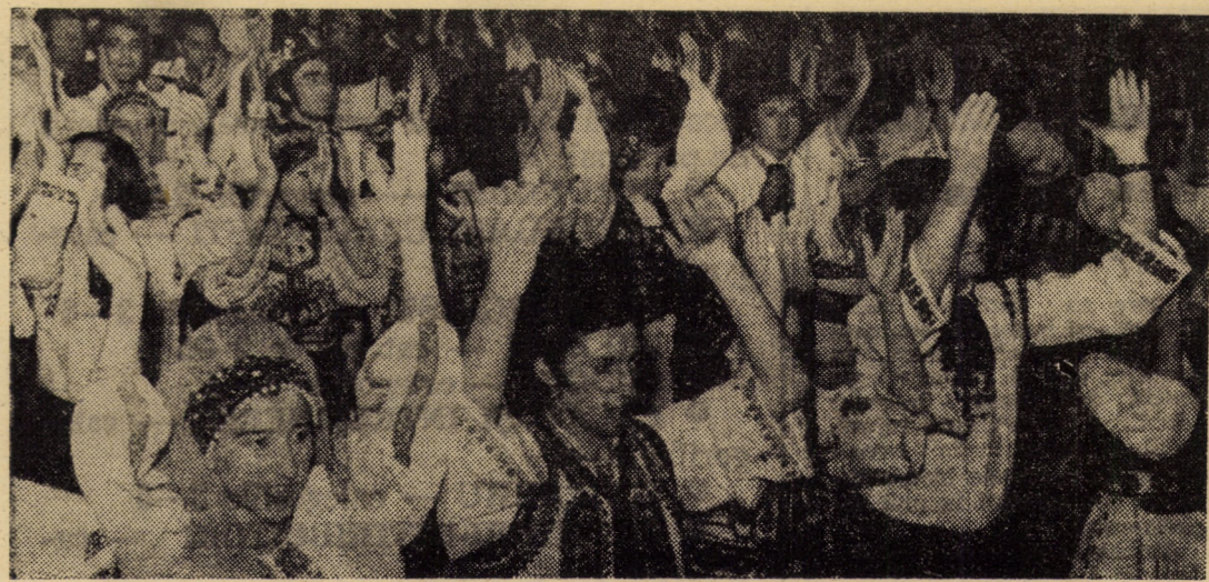
Secvență de intensă vibrație patriotică din spectacolul omagial dedicat Unirii la Casa de cultură a sindicatelor din Sibiu