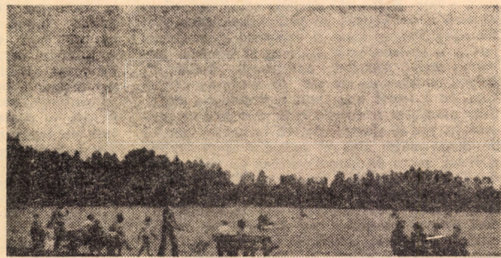
În zilele încă însozite prin Dumbrava Sibiuului

Menționăm că fiind necesare echipamente adecvat sezonului de iarnă, precum și lanterne,