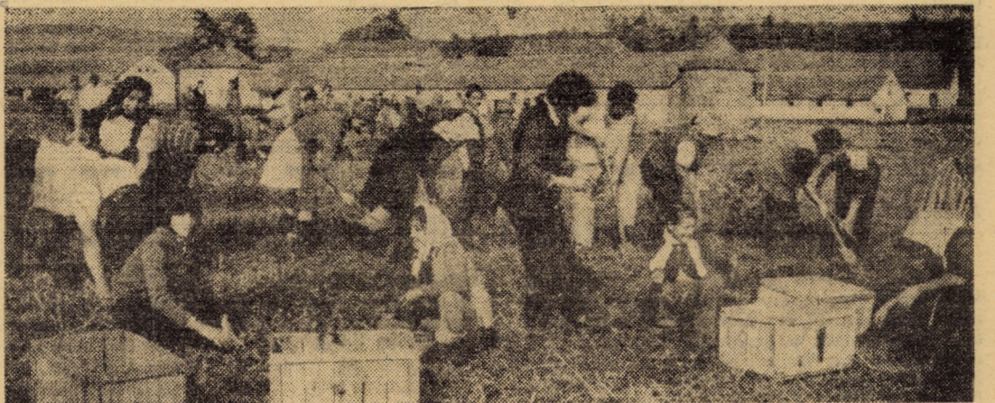
La Cooperativa agricolă de producție din Alțina se acționează ferm pentru transpunerea în viață a indicațiilor Comandamentului județean pentru coordonarea lucrărilor agricole. În acest sens, de la primar pînă la ultimul locuitor, toată obștea se află în cîmp la strînsul recoltei. Merită subliniat faptul că pentru a crea posibilitatea mijloacelor mecanice să lucreze efectiv la pregătirea terenului și însămîntări, la transport sînt folosite și atelajele proprietatea locuitorilor. Imaginea ce v-o prezentăm a surprins o secvență de muncă din grădina de legume.