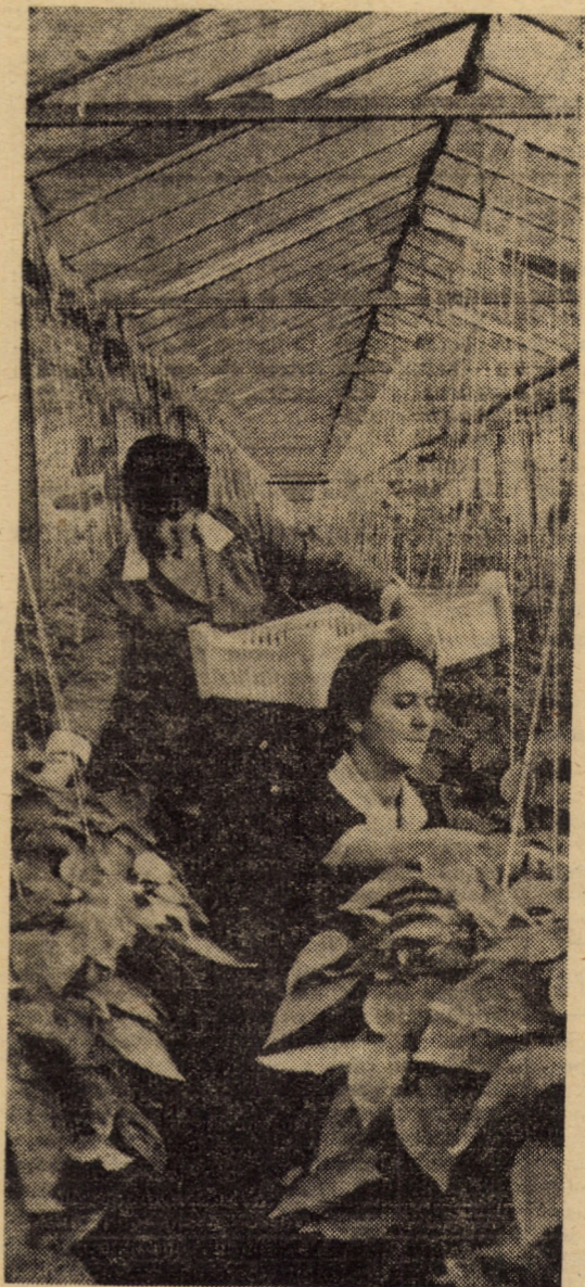
Recoltarea ardeilor, grași în serele de producție Dumbrăveni