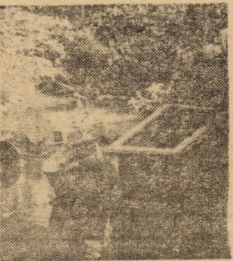
Parcul „Sub arini” Sibiu