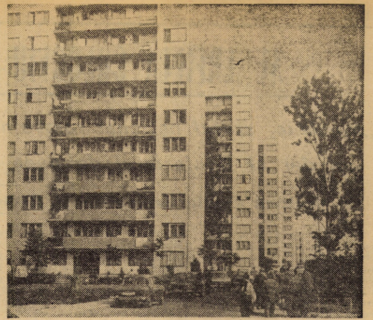
„Inălțimi” contemporane în Hipodrom III — Sibiu

rea gamei de mașini și utilaje fabricate de cunoscuta întreprindere sibiană de asimilarea unor produse cu un grad tot mai mare de tehnicitate. Miinile acestui muncitor au vegheat ca piesele multor prototipură să fie executate cu