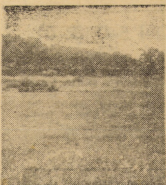
Valea Aurie Sibiu

Nu se gîndește chiar nimeni că mult mai ușor ar fi să fie menținută curățenia, puritatea mediului și destinația unor lucrări pentru care se consumă atîtea eforturi?