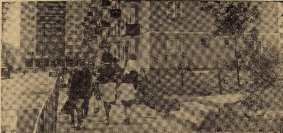
Noul cartier „Gura Cimpului” din Mediaș, înălțat în anii marilor prefaceri revoluționare

cim bine, dar dorim să trăim și să muncim și mai bine, reducînd astfel vertiginos decalajul care ne mai desparte de țările industrializate avansate. Urmînd indicațiile secretarului general al partidului tovarășul Nicolae Ceaușescu, poporul și-a propus să efectueze un adevărat salt spre o nouă calitate în tot ceea ce gîndește și întreprinde. Nu va fi o încercare ușoară însă oamenii muncii din județul nostru — români, germani, maghiari — sînt hotărîți să facă totul pentru a se situa la înălțimea sarcinilor trasate. Și, rezultatele raportate de aceștia în cinstea mării sărbători, angajamentele asumate cu acest prilej fac din plin dovada hotărîrii de neclintit de a traduce angajamentul în concrete fapte de muncă.