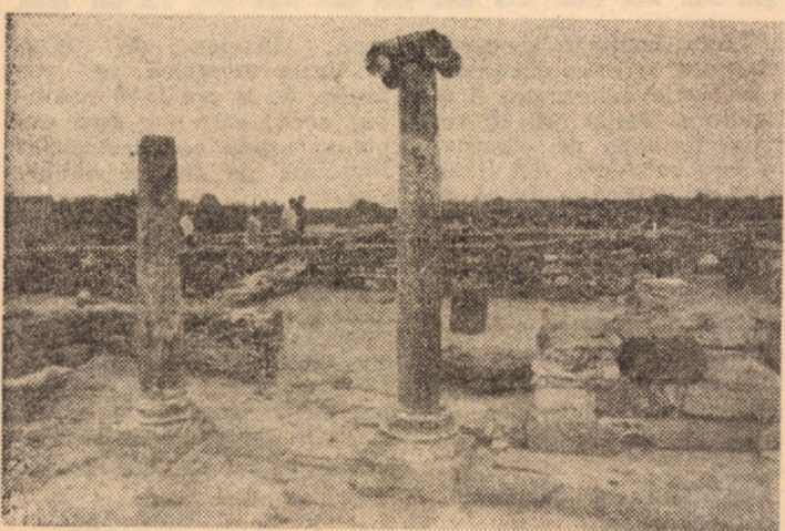
Histrion — relicve istorice — îndemnuri la meditație

METE (meteorol IULIAN În urm le, vrem moasă ș să se în rul va f și senin mineață, sufia me și sud-est rile min la între iar cele 25 și 28