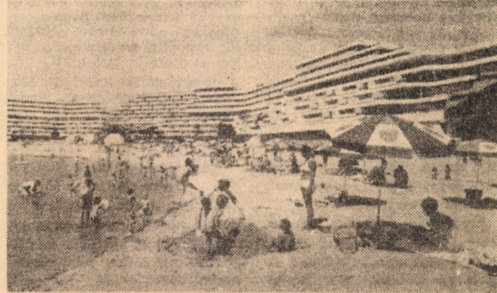
Sub soarele bineficent al Mării Negre