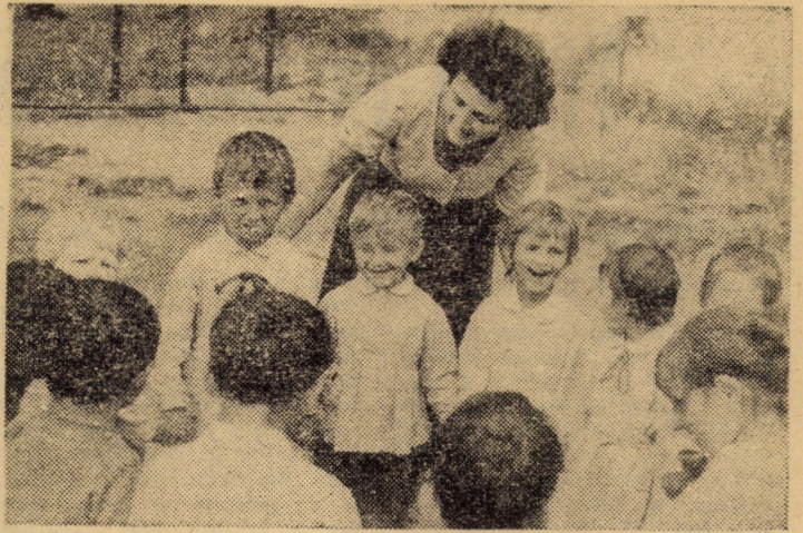
Bună dispoziție la Grădinița nr. 3 a întreprinderii Geamuri Medias