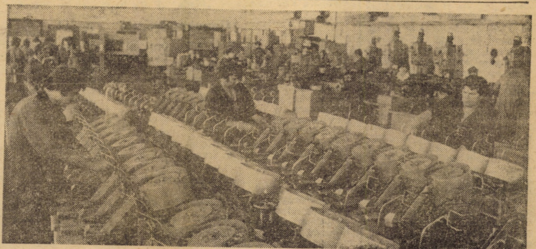
Îmbunătățiri constructive au fost aduse mașinilor de canetat, destinate industriei textile, pe care le fabrică întreprinderea „Balanta” din Sibiu