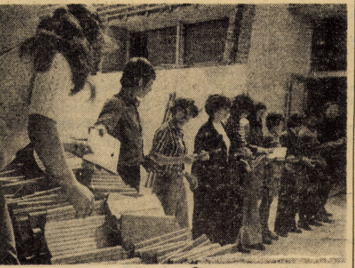
Activități de muncă patriotică pe șantierele Magazinului Universal Sibiu

Tălmăciu. La zestrea edilitară a viitorului oraș localnicii au adăugat două săli de clasă și un spațiu pentru 40 locuri destinat atelierului la Școala generală nr. 2. Acestor lucrări materializate din contribuția bănească a cetățenilor se adaugă vestiarul construit la terenul de sport și săpăturile la fundația blocului 6 (proprietate personală cu sprijinul statului) la care se înregistrează un însemnat număr de ore de muncă patriotică. Sint în curs de definitivare alte două blocuri de locuințe (total 40 apartamente) proprietate de stat, din cartierul Firul roșu, prevăzute a fi predare locatarilor în cîntea zilei de 23 August.