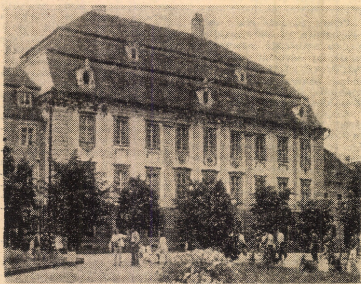
Muzeul Brukenthal din Sibiu este frecventat de un număr tot mai mare de vizitatori veniți din toate colțurile lumii