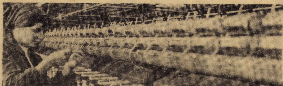
Astăzi în industria textilă a județului — o fotografie pentru albumul împlinirilor noastre socialiste

Clubul „7 Noiembrie” Sibiu, în colaborare cu organizațiile U.T.C. din întreprinderile „7 Noiembrie”, „Flamura roșie”, și „13 Decembrie”, organizează pentru miine — beneficiari tinerii din căminele de nefamiliști ale întreprinderilor amintite — o drumetrie la Rășinari, cu punct central — vizitarea Casei memoriale „Octavian Goga”. Plecarea are loc la ora 8.