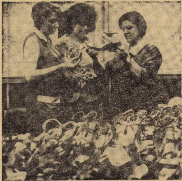
Atelierul de creație al întreprinderii de încălțăminte și pielărie Agnita. — Printr-o muncă susținută a colectivului de creație, aici s-a reușit pregătirea a peste 100 noi modele de încălțăminte