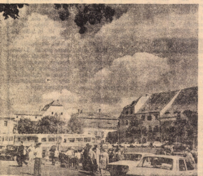
An de an numărul turiștilor care ne vizitează urbea e în continuă creștere

Miine, de la ora 11, pe terenul din parcul „Sub arini”, are loc partida amicală de fotbal dintre echipele Șoimii Sibiu și Politehnica Timișoara. Astăzi, la ora 14,30, timișorenii joacă la Mirșa cu divizionara C, Carpați.