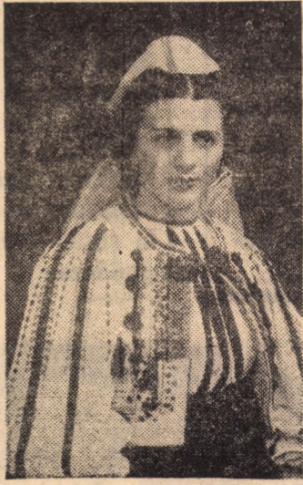
Frumusețea neintrecută a costumelor săliștenești de sărbătoare apare și-n această fotografie de acum peste 3 decenii: pieptarul cu vidră, pahiolul, ia cu ciocănele, toate în cromatica unei simplități de mare valoare estetică (alb-negru)

Impresionat de articolul nostru cu spațiile verzi din Sibiu, cititorul Spiridon Ștefănescu din Mediaș ne trimite o „opinie în versuri (am fi preferat o... proză la concret): „Dar ades pe lingă bloc / Spații verzi nu, sint deloc / Parcă înima te doare / Că nu vezi măcar o floare” (...)