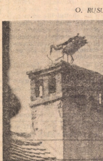
O nouă familie de berze își clădește cuibul

tate. În acest sat cu 30 de ani în urmă numărul berzelor era de peste 60, în 1963 a scăzut la 43 pentru ca în 1975 să ajungă doar la 21. Descreșterea vertiginosă s-a datorat în primul rând înlocuirii șurilor cu acoperiș de paie. Profesorul și tinerii lui pionieri i-au determinat pe țărani să construiască pe acoperișurile de lemn ale noilor suri suporturi pentru cuiburi; ca rezultat numărul berzelor a început să crească ajungând în 1977 la 28. Această experiență demonstrează importanța mediului școlar pentru transmiterea unor nobile pasiuni tinerei generații”. Frumoasa apreciere i-a găsit pe scoreeni, ocolitori ai berzelor, în plină activitate. În această primăvară au fost confecționate 11 suporturi, 6 dintre ele gășindu-și imediat