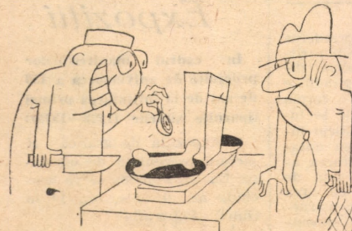
Mai punem și bucățica asta de carne? Desen de: ADRIAN POPESCU