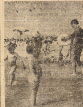
Strand — Neptun.

În Polonia a fost realizată o substanță care neutralizează petele de petrol de pe mări și oceane. Respectivă substanță organică nu este toxică și nu intră în compoziție chimică cu apa, nu se scufundă și poate să fie ușor îndepărtată de pe suprafața mării. Petele de petrol neutralizate cu substanța poloneză care se numește „Posteora” pot pluti pe suprafața mării, timp de câteva luni. „Posteora” va găsi o largă întrebuințare în porturi, lângă platformele de foraj marin și în apropierea plajelor unde apa este foarte poluată. (Agerpres)