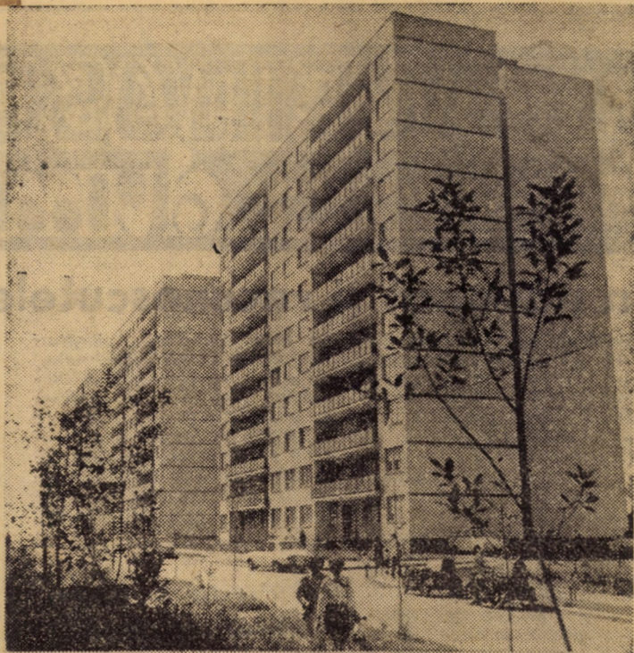
Blocuri moderne cu zece etaje din str. Radu Șerban, cartierul Hipodrom III Sibiu