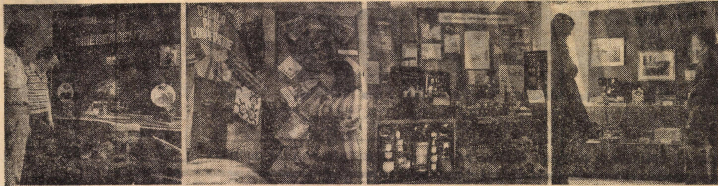
Secvență din Expoziția județeană de creație tehnică intitulată „TEHNIUM”, deschisă în aceste zile la Casa de cultură a tineretului din Sibiu, cuprinzând printre exponate interesante creații tehnice originale realizate de elevi din licee