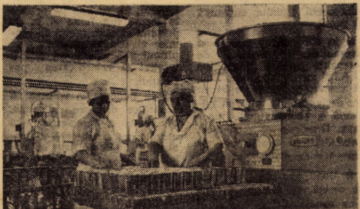
Întreprinderea de industrializarea cărnii Sibiu. Dozator automat pentru umplerea și dozarea cutiilor de conserve prin care se realizează o mai bună igienizare a produselor, fiind înlocuite totodată o serie de operațiuni ce în trecut se executau manual.