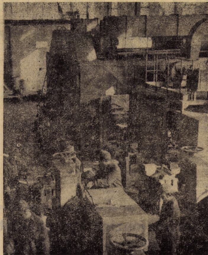
Instalații automate de vopsit din atelierul vopsitorie al întreprinderii mecanica Sibiu

Amplificîndu-și eforturile în întrecerea socialistă, oamenii muncii de la „Vitrometan” sînt hotărîți să raporteze cu cel puțin o săptămîină mai devreme îndeplinirea prevederilor planului semestrial și la ceilalți indicatori economici.