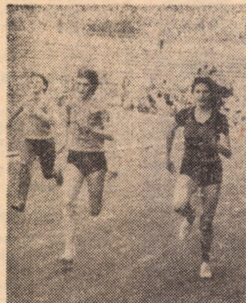
Aspecte ale la tetratlonul atletice școlar