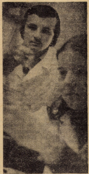
Deslușirea tainelor chimiei în laboratoarele Facultății de mecanică din Sibiu

(Continuare în pag. a III-a) ION SORESCU