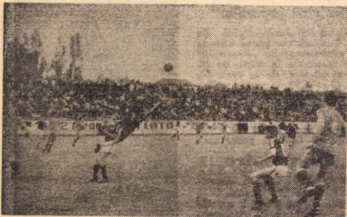
Unul din „zborurile“ formidabilului Ioniță. Muscă e uimit, iar Turlea privește admirativ parcă