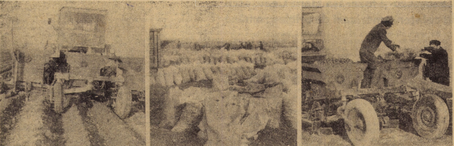
Secvențele surprinse cu aparatul de fotografiat sînt edificatoare pentru hotărîrea cu care acționează cooperatorii din Arpașu de Jos pentru urgentarea plantării cartofilor, în condiții calitative superioare