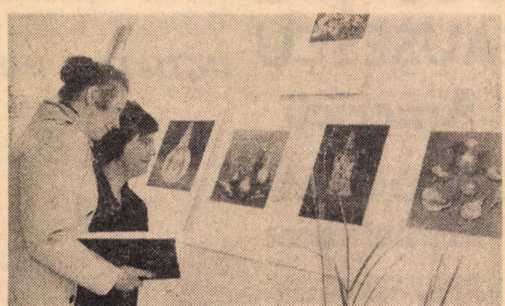
Cadru din expoziția cu reproduceri color „Piese rare din muzee”, organizată de întreprinderea poligrafică Sibiu în rîndul festivităților de aniversare a 450 ani de la înființarea primei tiparnice la Sibiu, deschisă în 31.III.1978 la Casa artelor din localitate. Orar de vizionare: zilnic între orele 8-19

secției artistice a „ASTREI” a desfășurat o bogată activitate muzicală, dirijînd numeroase concerte. Profesorul Nicolae Oancea a apreciat în mod deosebit folclorul, izvorul viu și nesecat al muzicii românești. Pe baza bogatului material folcloric pe care l-a strîns cu devotament din diferite zone ale țării, a armonizat și compus cîntece populare românești foarte frumoase, pentru voce, pian, cor mixt și bărbătesc. Mărturie a acestei popularități stau colecțiile de cîntece răspîndite în toată țara și în străinătate: „Cîntece populare românești” (1922 și 1924) „Cîntece patriotice” (1926), „La horă-n sat” (1935) etc. În 1960 a compus suita pentru cor mixt „Bucuria muncii” iar doi ani mai tîrziu „Floarea muncii”. Editura muzicală a publicat în anul 1966 o colecție de CORURI , cuprinzînd lucrări reprezentative din creația celui care și-a dedicat toată viața propășirii muzicii românești. Prof. CAROL COMȘA