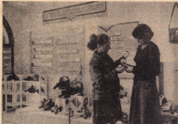
La Centrul de informare și reclamă al U.J.C.M. Sibiu se vor organiza periodic (în fiecare 15 ale lunii) expoziții de prezentare și vânzare a produselor — creații de ultimă oră ale unităților cooperatiste meșteșugărești din Sibiu, Mediaș, Agnita, etc. Prima de acest gen o reprezintă expoziția cu articole de încălziminte și marochinărie, cu peste 70 exponate, de unde vă redăm și imaginea de față