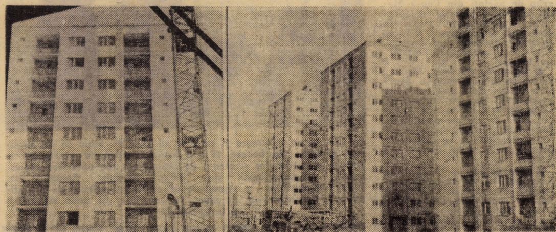
Dintre noile construcții cu 10 etaje — blocurile 3 (stînga), 6, 8, 10 (dreapta) — din cartierul de locuințe „Vasile Aaron” din Sibiu, primele două au fost predate locatarilor, celelalte aflîndu-se în fază avansată de finisaj