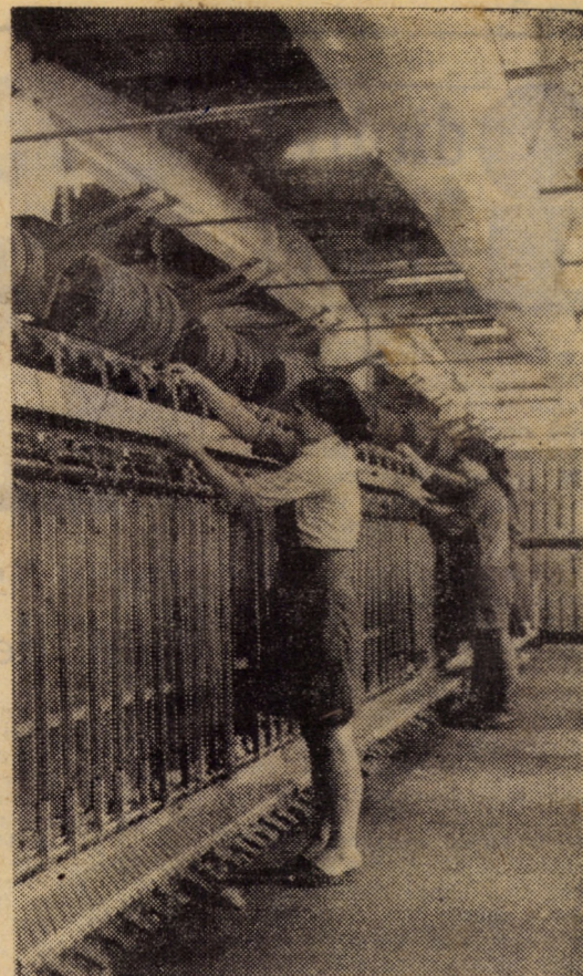
Fabrica de pături „Progresul” Orlat. Mașini cu inele de mare randament din secția filatură — una din fazele de pregătire a firelor pentru țesătorie

Cu această piesă, Teatrul de păpuși sibian participă și în cadrul Festivalului național al teatrelor de păpuși din Bulgaria, care se va desfășura la Haskovo între 7—9 aprilie a.c.